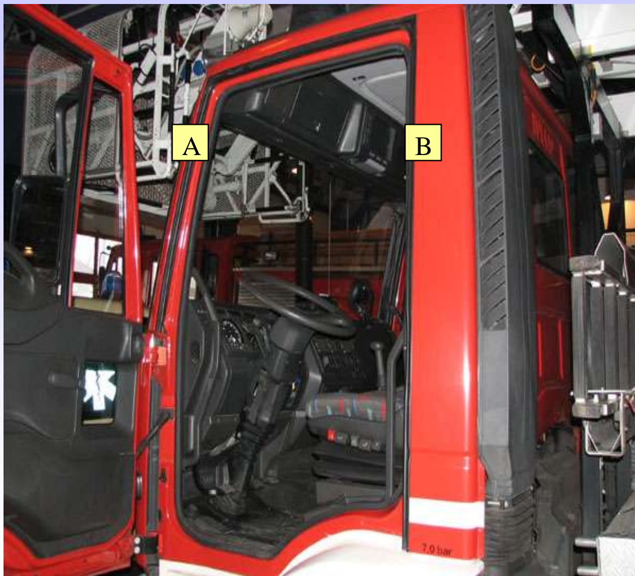
Oznaczenie słupków kabin ciężarowych